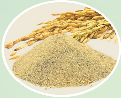
CÁM GẠO TRÍCH LI (Deoiled Rice Bran)