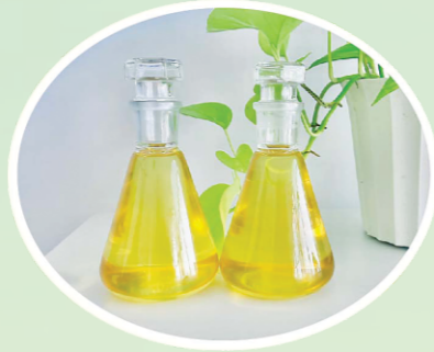
DẦU GẠO TINH LUYỆN (Refined Rice Oil)