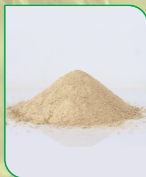
Cám gạo khử dầu (DORB hoặc DOB) De Oiled Rice Bran (DORB or DOB)