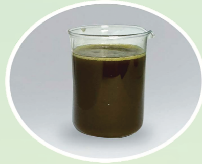
DẦU GẠO THÔ (Crude Rice Bran Oil)