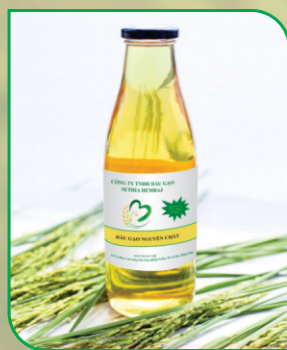
Dầu cám gạo tinh luyện Refined Rice Bran Oil

Using advanced technology and applying international quality management standards like HACCP, ISO 22000, Halal, Kosher, etc., our company produces the best quality products that meet strict requirements of the most demanding markets. Lô 1-3, Zone C extended, Sa Dec Industrial Zone, Sa Dec City, Dong Thap Province, Vietnam.