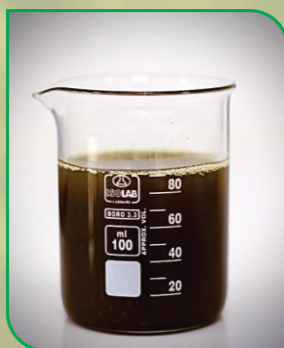
Dầu cám gạo thô Crude Rice Bran Oil